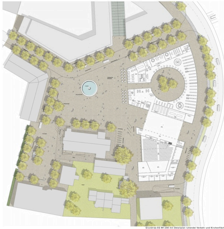
Grundriss EG M1:200 mit Detailplan ruhender Verkehr und Kirchenflächen