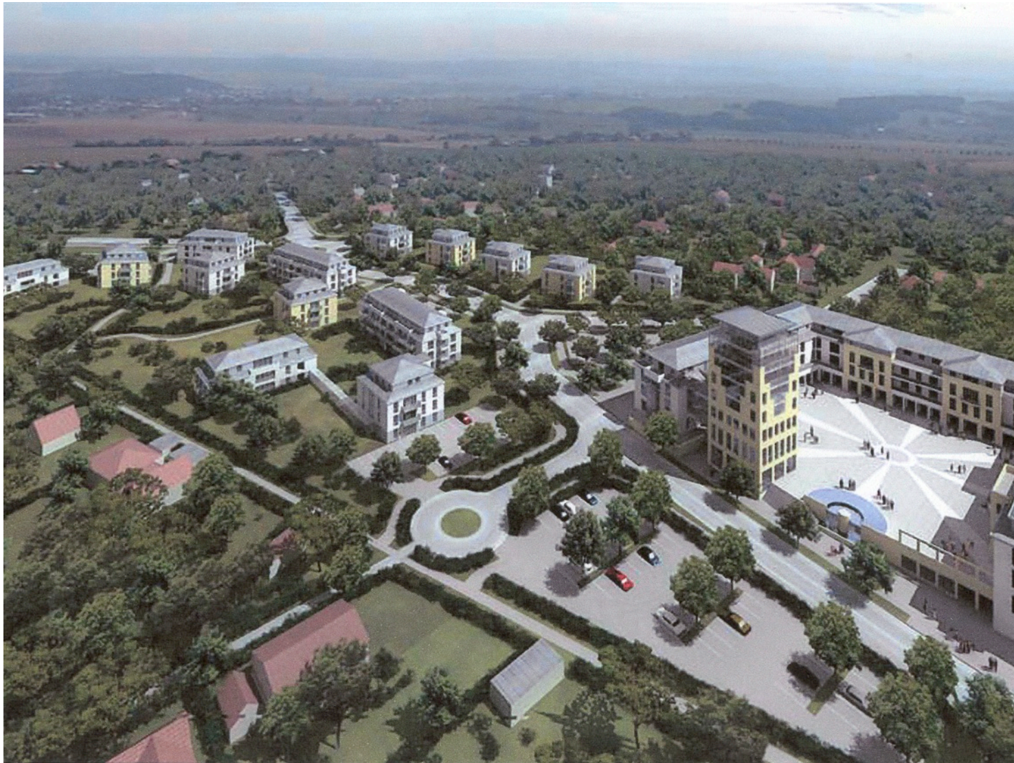
2002 3D-Darstellung Fa. Bauhaus